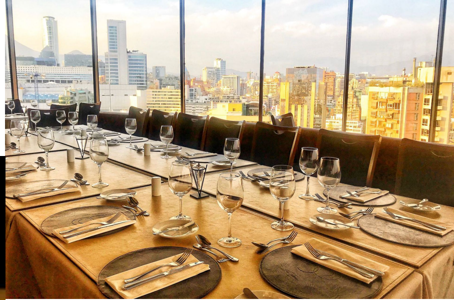
Comida en restaurante emblemático en Santiago de Chile